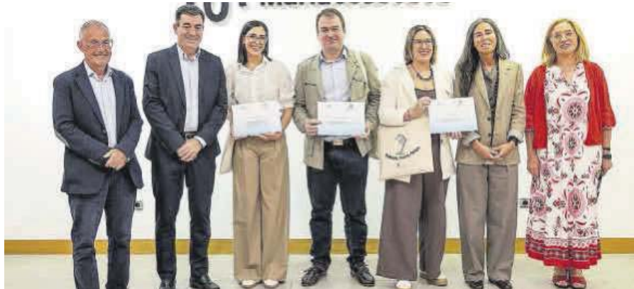
Autoridades con la ganadora y las finalistas. | LOC

Un proyecto de teatro para alumnos con TDAH, becado por la entidad e Ingada